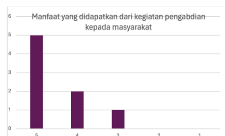
Gambar 1. Grafik Responden tentang Kebermanfaatan

Kesesuaian Program Pengabdian dengan Kebutuhan Mitra juga dinilai sangat positif, dengan sebagian besar responden memberikan skor 5. Ini menunjukkan bahwa program pengabdian telah dirancang dengan baik sesuai dengan kebutuhan dan harapan mitra. Selain itu, aspek Manfaat yang Diperoleh dari Kegiatan Pengabdian juga mendapatkan penilaian yang sangat baik. Sebagian besar responden memberikan skor 4 dan 5, menunjukkan bahwa kegiatan ini memberikan dampak yang signifikan dan dirasakan langsung manfaatnya oleh masyarakat.