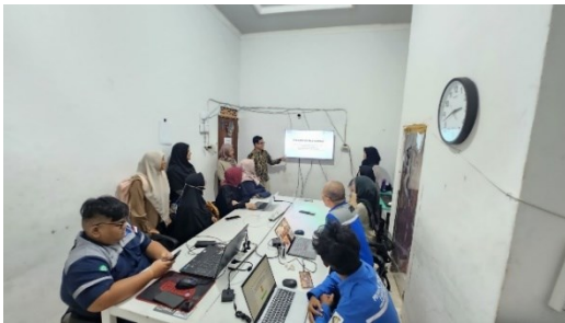
Gambar 1. Penyampaian Materi Penyusunan Laporan Keuangan.

Melalui pemahaman dan penerapan yang baik terhadap pencatatan transaksi kas, diharapkan perusahaan dapat memiliki dasar yang kuat untuk mengambil keputusan-keputusan strategis yang lebih terukur. Selain itu, laporan keuangan yang terstruktur dengan baik juga akan meningkatkan kredibilitas perusahaan di mata mitra bisnis dan pihak eksternal lainnya. Dengan cara ini, perusahaan tidak hanya mampu menjaga keberlanjutan operasionalnya, tetapi juga memperkuat posisinya dalam menghadapi tantangan dan memanfaatkan peluang di pasar yang kompetitif.