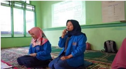
Gambar 3. Pelatihan Pencatatan Keuangan Sederhana dengan Aplikasi Android

elektronik sekaligus penggunaannya dengan bantuan aplikasi berbasis digital.