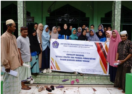
Gambar 7. Peserta Pelatihan dan Sosialisasi Warga Desa Tonrorita Kab. Gowa SulSel

Setelah pelaksanaan kegiatan pengabdian masyarakat, tercapai pemahaman peserta mengenai teknologi digital dan sekaligus mampu mengaplikasikan teknologi digital seperti laporan keuangan digital berbasis android dan uang elektronik berbasis digital dengan baik.