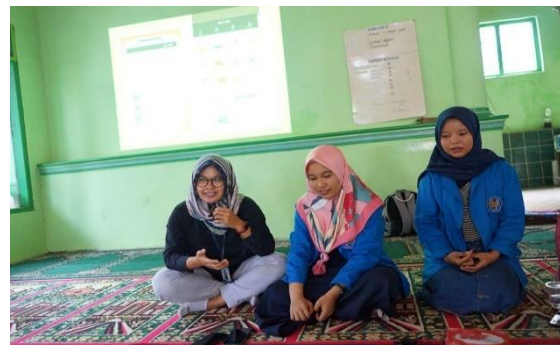
Gambar 6. Pengenalan Aplikasi Bisnis Digital dan Uang Elektronik

dijelaskan mengenai apa itu bisnis digital dan aktivitas sharing economy serta uang elektronik dan manfaat penggunaannya. Pemaparan materi kepada peserta dimaksudkan untuk lebih mengedukasi dan menstimulus rasa ingin tahu peserta tentang kemanfaatan aplikasi bisnis digital dan uang elektronik khususnya bagi efisiensi transaksi ekonomi. Setelah mendapat respon positif peserta, selanjutnya diberikan praktik penggunaan uang elektronik dengan menggunakan aplikasi android. Hal ini dilakukan untuk lebih memahamkan peserta tentang aplikasi bisnis digital dan uang elektronik serta cara pemanfaatannya dalam transaksi ekonomi.