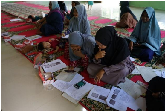
Gambar 5. Pelatihan Pencatatan Keuangan Sederhana dengan Aplikasi Android

Pada sesi ketiga, pengenalan aplikasi bisnis digital dan uang elektronik serta penggunaannya dengan aplikasi android di fasilitasi oleh Asriani Hasan dan dibantu oleh asisten. pada awal pembahasan,