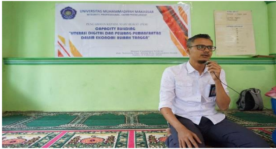
Gambar 2. Materi Literasi Digital & Manfaat dalam Ekonomi RT

Kecenderungan sekarang memperlihatkan aktivitas masyarakat mengarah pada penggunaan teknologi digital baik dalam cara hidup, bekerja, bahkan dalam berhubungan sosial dengan masyarakat. Dalamnya penetrasi digital masuk kedalam kehidupan masyarakat mengharuskan masyarakat harus beradaptasi dengan kondisi tersebut. Penetrasi digital tidak hanya menjangkau wilayah urban saja namun juga cakupannya meluas bahkan sampai pada ranah pedesaan. Luasnya cakupan penetrasi teknologi digital juga berdampak pada perubahan pola hidup masyarakat pedesaan. Salah satu dimensi yang disasar oleh teknologi digital adalah aktivitas ekonomi rumah tangga pedesaan. Hari ini, telah banyak perubahan pola aktivitas ekonomi yang terjadi akibat massiv nya penetrasi digital. Munculnya uang elektronik adalah salah satu dampak dari teknologi digital. Uang elektronik memberikan kemudahan bagi masyarakat dalam melakukan transaksi ekonomi dan cenderung terjadi efisiensi ekonomi bila